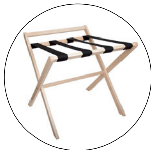
Image de marque personnalisée